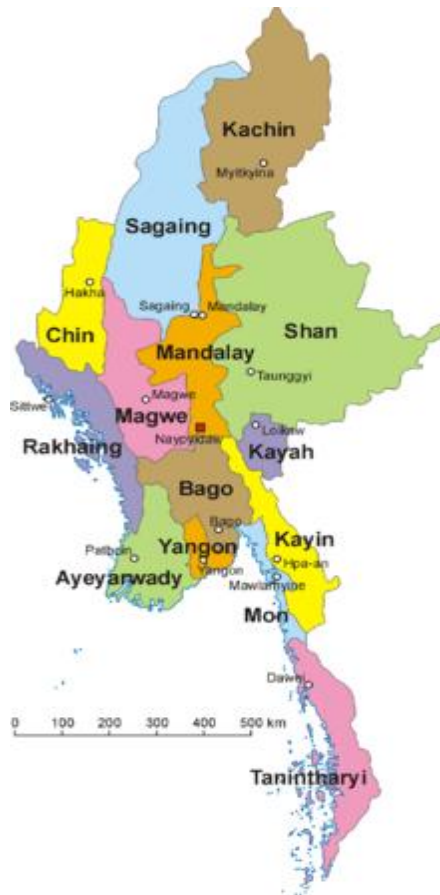
รูปแสดงเขตการปกครองของประเทศพม่า

1.4 สมาชิกองค์การระหว่างประเทศ : เข้าร่วมเป็นสมาชิก GMS เมื่อปี 2535 / สมาชิก ASEAN เมื่อวันที่ 23 กรกฎาคม 2540 / สมาชิก BIMSTEC เมื่อวันที่ 22 ธันวาคม 2540 และ สมาชิก WTO เดือนมกราคม 2538